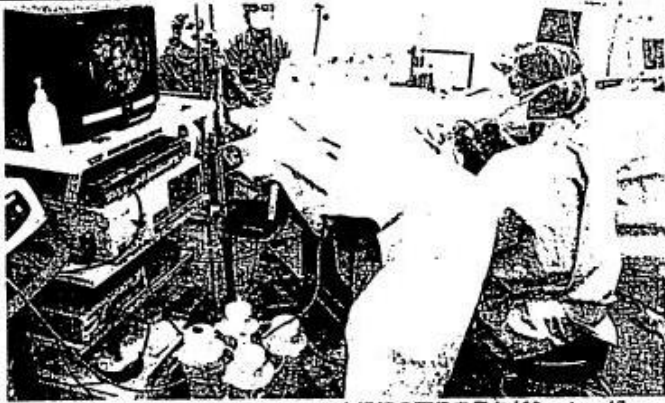
内視鏡の画像を見ながら、レーザーを照射するホーレップ手術＝いずれも西宮市林田町