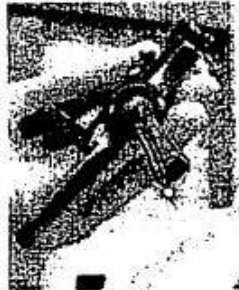
ホルミウムイオンレーザーは目に見えないため、赤いライト光で照射範囲を示す